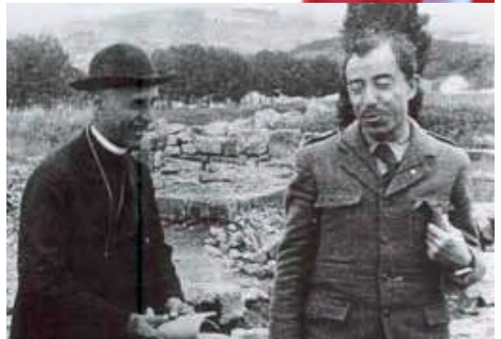
Josep Maria Batista i Roca

La conseqüència de pertànyer a una comunitat nacional és el dret de rebre una educació nacional, és a dir, en la llengua i d'acord a les tradicions culturals i nacionals de la pròpia comunitat.