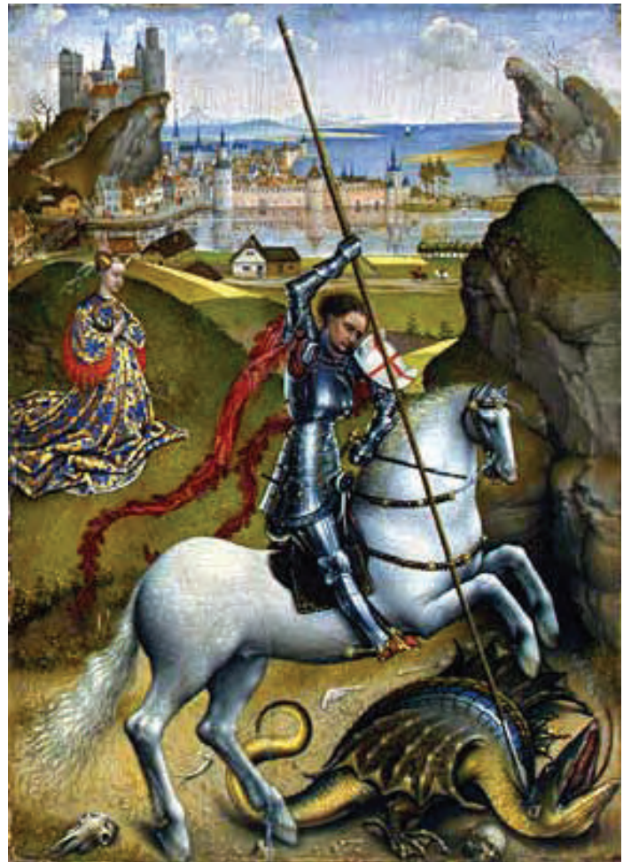
Sant Jordi matant el drac

La veiem amb múltiples representacions, a les pintures murals del Saló del Tinell i del Palau Aguilar, del segle XIII, on es representa la conquesta de Mallorca (pintures avui en dia conservades al Museu Nacional d'Art de Catalunya MNAC), a l'expedició dels Almogàvers, on, segons Ramon Muntaner a la seva Crònica, la Creu De Sant Jordi fou ensenya de combat, a les Ordinacions de la Host Veïnal (1395): «Que per los Consellers, de present sia fet un penó larch ab senyal de Sant Jordi, ço és, la creu vermella e lo camp blanc, qui és senyal de la ciutat» (1395).