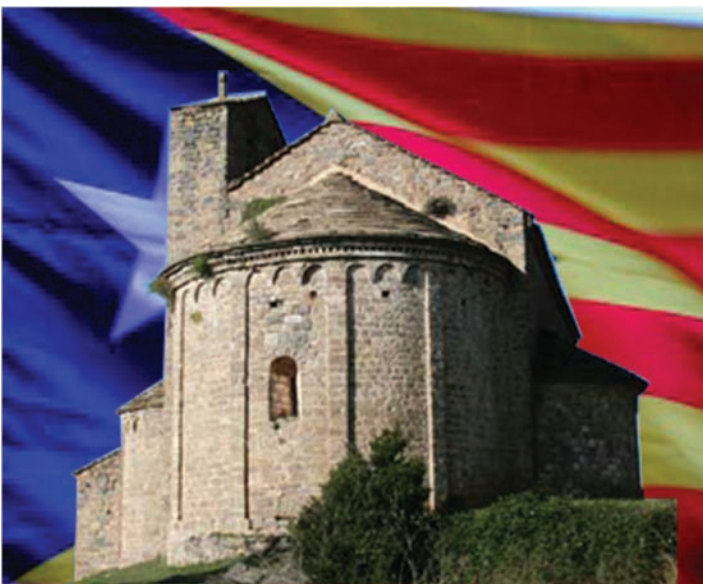
Monestir de Montgrony, no et pots perdre aquest indret.

Esperem comptar amb tu durant el segon Dia del Partit.